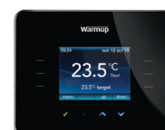
3iE Energimonitor Termostat