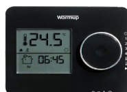
tempo Programmerbar termostat