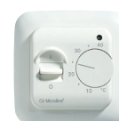
Manuell Termostat MSTAT