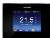
4iE Smart Wifi Termostat